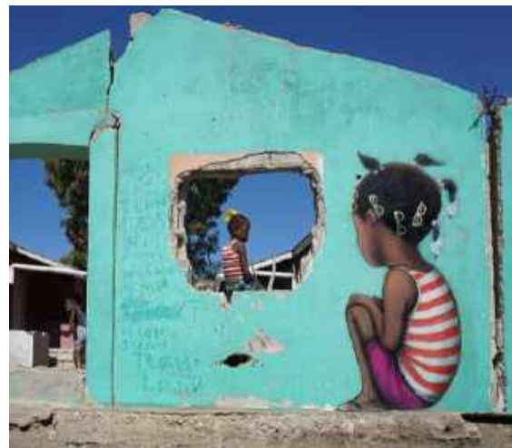
"Made in Haiti", Haïti, 2019