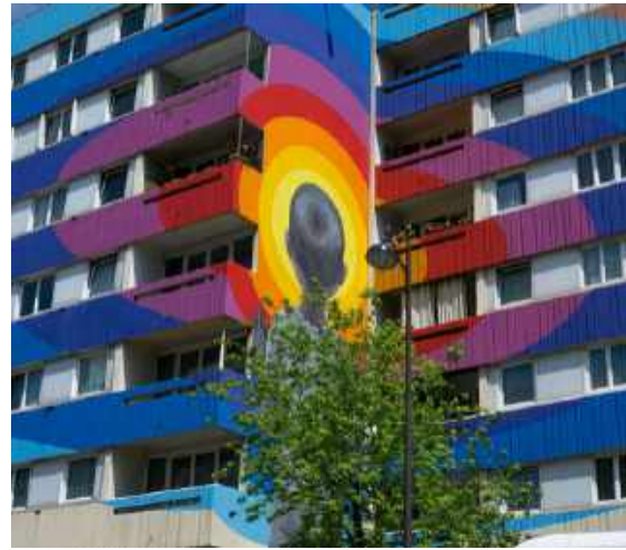
Boulevard Paris 13, France, 2019