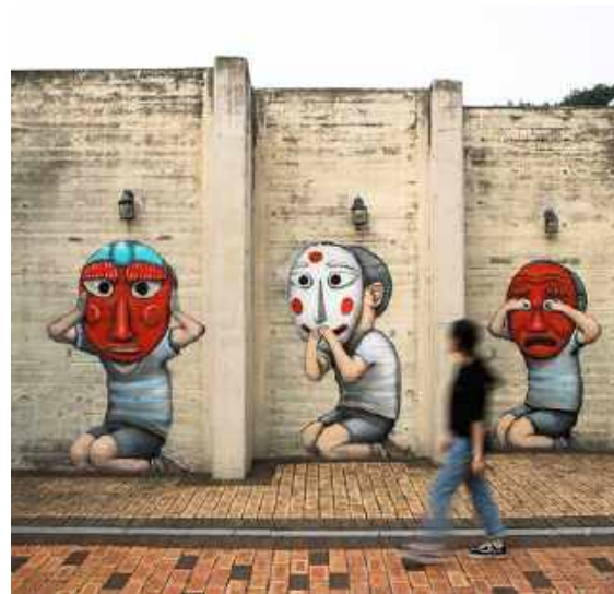
Université de Chosun, Corée, 2019