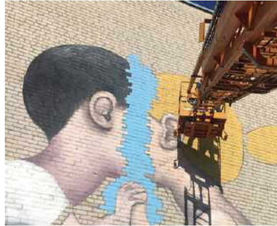
"Popasna", Ukraine, 2019