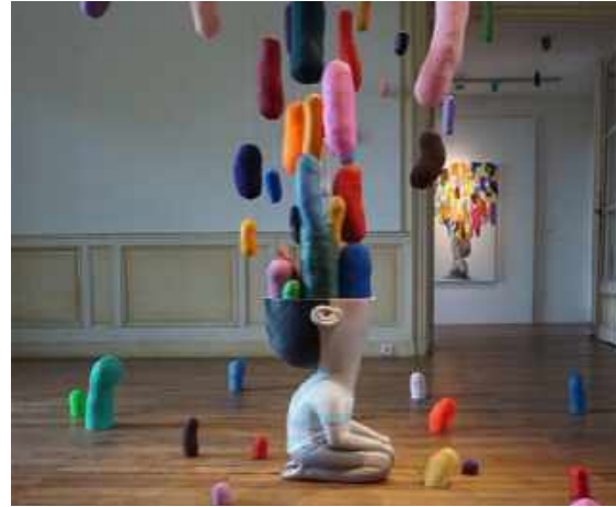
Institut culturel Bernard Magrez, France, 2019