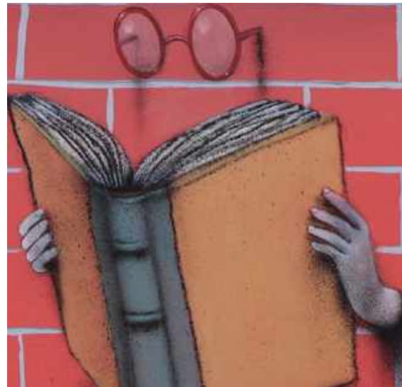
"Le passe muraille", Marché des Batignolles, France, 2019